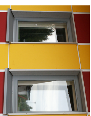
Vesivahmaan päiväkotä, Asikkala